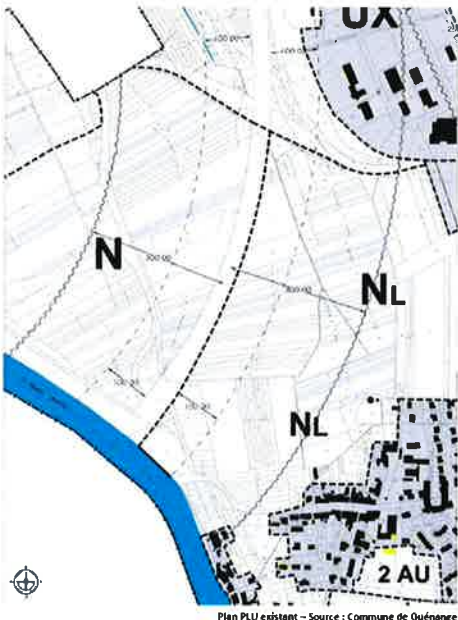
Plan PLU existant