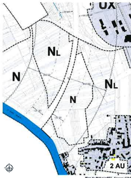
Plan du PLU modifié