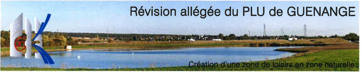
Création d'une zone de loisirs en zone naturelle