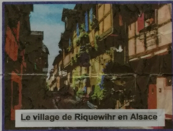
Le village de Riquewihr en Alsace

Départ : place de la Mairie 7 h 00 retour prévu : place de la Mairie 21 h 00