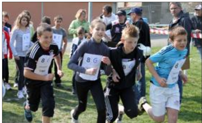
Le cross par équipes rassemblera vingt-trois classes de la circonscription au stade de Metzervisse.

Jeudi, la 22 e édition du cross par équipes Usep de la circonscription d'Uckange, organisé par l'Association sportive et socio-éducative (ASSE) du groupe scolaire Jean-Moulin se déroulera au stade municipal de Metzervisse. Depuis une dizaine d'années, cette compétition est dotée du Challenge de la Bibiche Joseph Boulluing détenu pour un an par la classe de CE1 de Richemont qui la remettra en jeu.