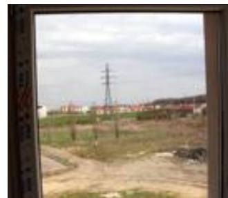
Le cœur de ville aujourd'hui : un pré aux vaches.

• Le secteur B. Un deuxième secteur se situe à quelques rues de là, sur l'emplacement des actuelles écoles maternelle et primaire Saint-Matthieu et de son gymnase. Le complexe scolaire devra être détruit. À sa place se dresseront des lieux d'habitation et un petit espace vert.