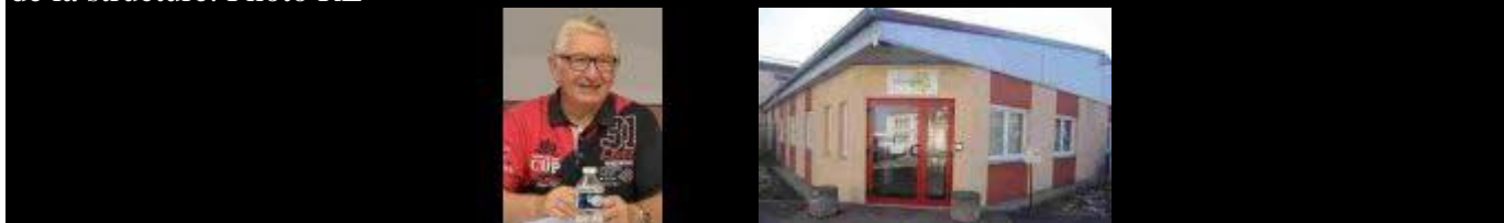
Photo HD Michel Bourhoven, le président, est présent chaque jour pour soutenir et encadrer les sept salariés de la structure. Photo RL

C'est une association au service des personnes « différentes » qui ont besoin d'une aide.