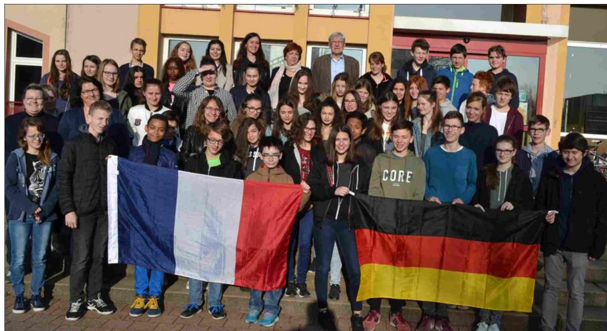
En dépit des drapeaux, qui pourraient le laisser supposer, pas de compétition mais l'entente cordiale !