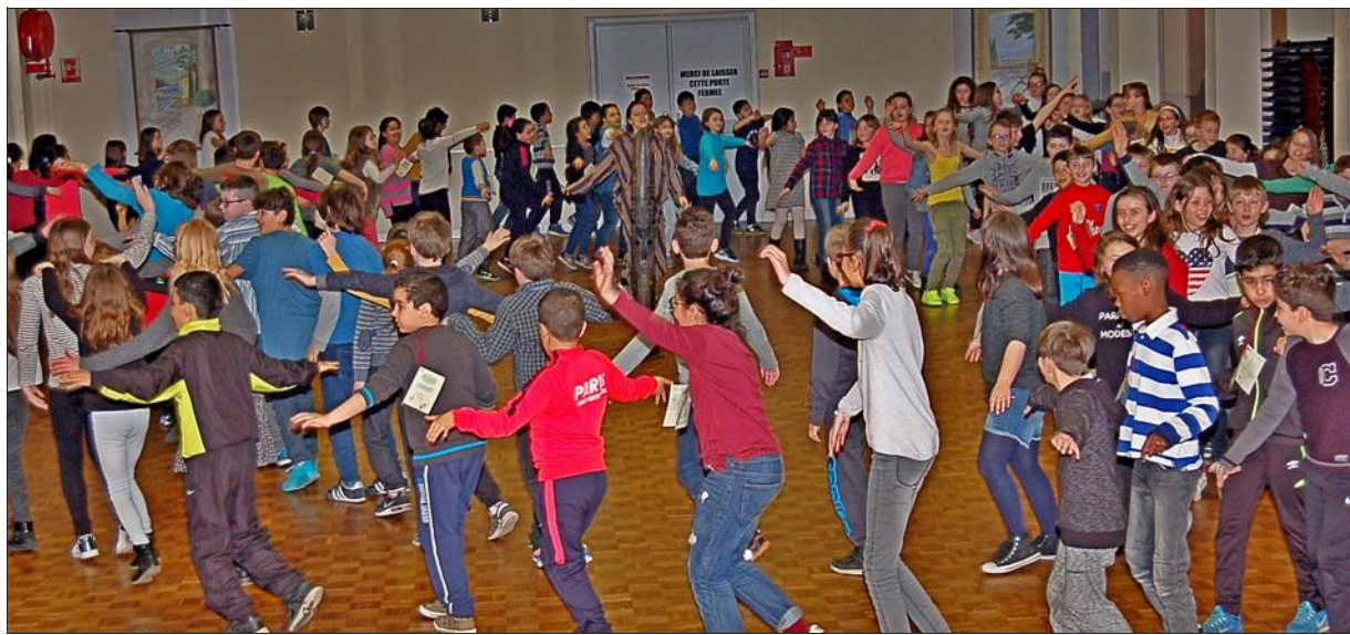
Rythmes et chaude ambiance africaine pour les écoliers du primaire.

Dans le cadre du Printemps des poètes, quatorze étudiants en formation à l'École supérieure du professorat et de l'éducation (Espé) de Metz-Montigny ont invité les élèves des écoles des Saules de Bousse et des écoles Paul-Verlaine et Jules-Ferry d'Ulckange à monter à bord de leur embarcation poétique à destination de l'Afrique. Ainsi, tout au long d'une matinée, à l'école des Saules de Bousse, les élèves ont expérimenté des formes de création poétique et de mises en voix de poème en lien avec la musique, les arts plastiques et la danse. L'après-midi a été l'occasion d'un rassemblement très convivial à la salle des fêtes de Bousse. Les élèves, accompagnés des étudiants de l'Espé et de leurs enseignants ont partagé leurs découvertes à travers le chant, la danse et la présentation d'un conte africain. A la fin de cette journée, l'inspecteur de Thionville IV Pascal Landragin a remis un diplôme de participation à chaque enfant. Merci à tous les participants investis dans ce sympathique projet, en particulier aux artistes Lassana Saar et Victor Sperandio.