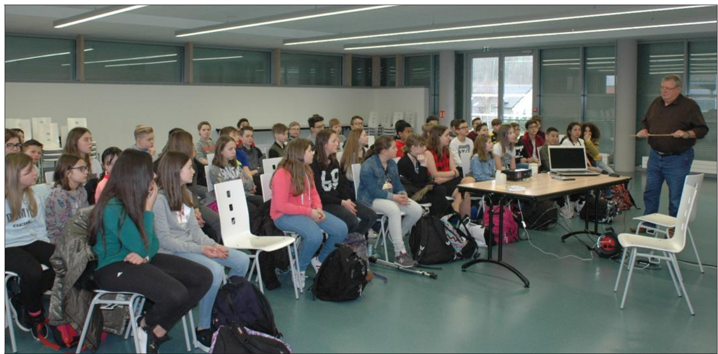
Des élèves ont été attentifs qui ont appris les gestes élémentaires

Ils viennent de passer une grosse journée au collège de la Canner pour sensibiliser les élèves aux déplacements en bus, plus de 90 % d'entre eux optant pour ce mode de déplacement. Les différentes phases des dangers propres au transport scolaire ont été commentées au début de la séance. D'abord l'attente du car (jeux dangereux en bordure de route), ensuite la montée (éviter les bousculades, on n'oublie pas de saluer le conducteur...), le trajet (rester assis, ceinture bouclée : ne pas se lever avant l'arrêt complet du car) puis la descente (attendre le départ du car avant de traverser la route, emprunter les passages piétons).