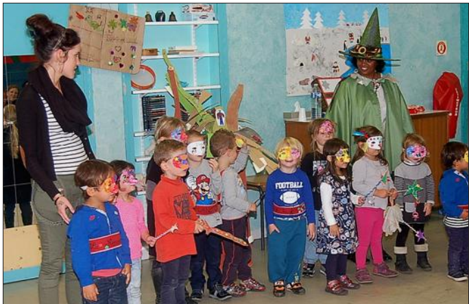
Une ambiance magique pour le centre aéré de Bousse.

Le centre aéré de Bousse, du 19 au 23 octobre, a eu l'immense privilège d'accueillir pas moins de 64 lutins, trolls, fées, le tout au milieu de la forêt Mystérieuse.