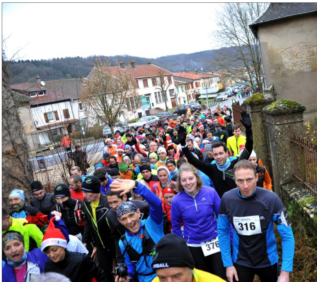
La première Kanerdall organisée par les Arts hombourgeois avait attiré plus de 600 coureurs en 2014.

coureurs a pris le départ sur le marathon où à la surprise générale, il termine 2e sur 148 équipes.