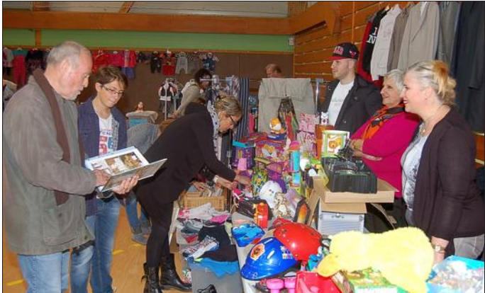
Un franc succès pour la bourse aux jouets, vêtements et puériculture organisée par l'APE boussoise.

Très grande affluence à la salle Georges-Brassens à l'occasion de la bourse aux jouets, à la layette et puériculture organisée par l'association des parents d'élèves (APE) de Bousse. C'était un défilé ininterrompu d'amateurs, à forte majorité juvénile, qui se pressaient devant la soixantaine d'exposants, tant Boussois que des localités voisines.